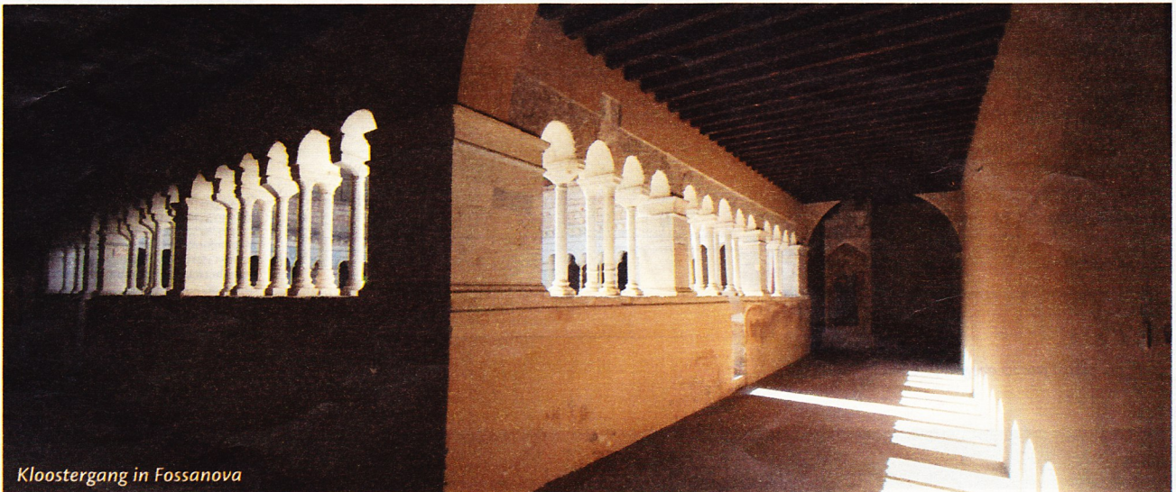
Kloostergang in Fossanova