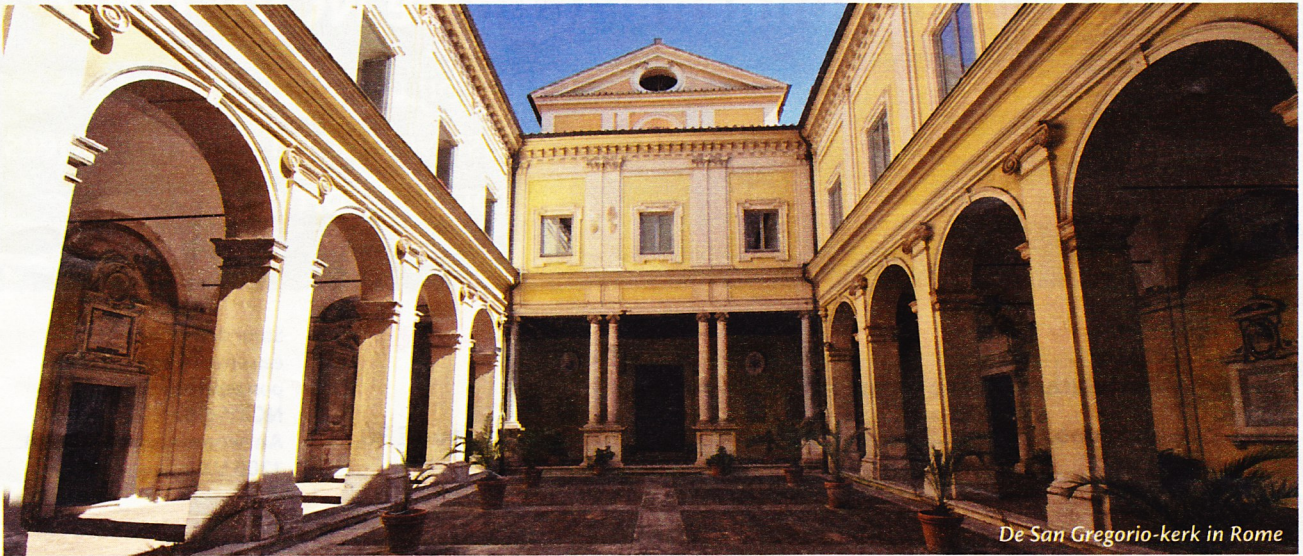
De San Gregorio-kerk in Rome